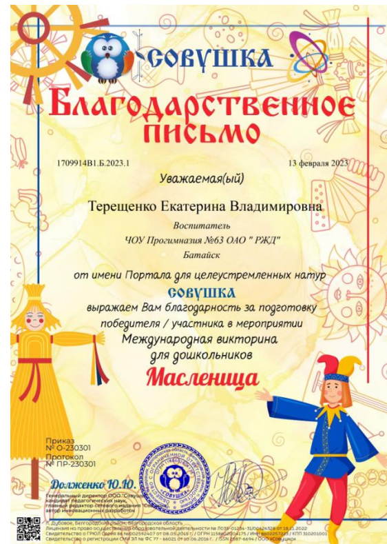
Международная викторина для дошкольников Масленица