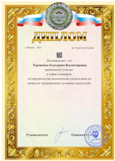
Сотрудничество воспитателя с родителями по вопросам традиционных духовных ценностей 2023г.