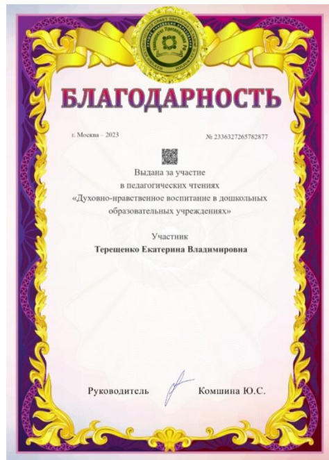
Пед. чтение «Духовно-нравственное воспитание в дошкольных учреждениях»