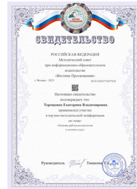
Научно – методическая конференция «Основы работы воспитателя в детском саду» 2023г.